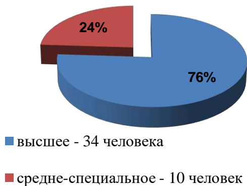
Профессиональное образование педагогов