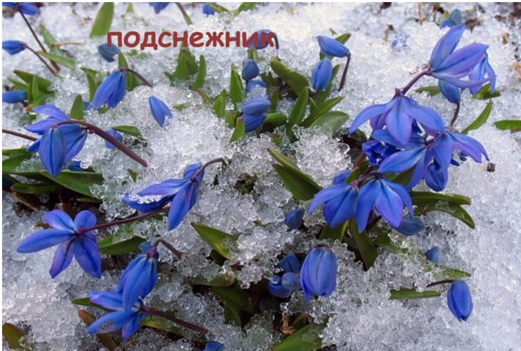
Пробивается росток, удивительный цветок. Из-под снега вырастает, солнце глянет — расцветает