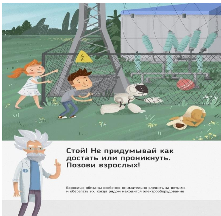
Рис. 5 Стой! Не придумывай как достать или проникнуть. Позови взрослых!