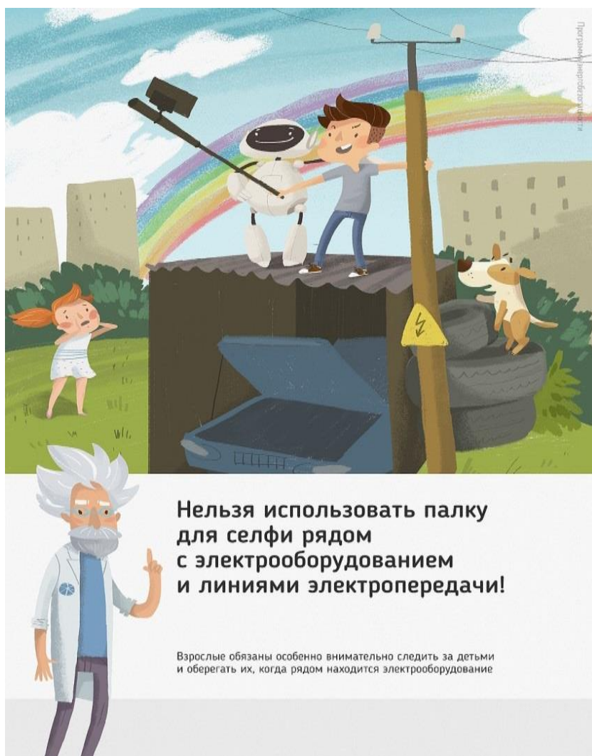
Рис 2. Нельзя использовать палку для селфи рядом с электрооборудованием и линиями электропередачи

Ну и, наконец, нужно повторить с ребенком алгоритм действий в экстремальной ситуации. Проверьте, умеет ли он набирать на сотовом телефоне телефон экстренных служб. Изучите с ним вещества и предметы, которые хорошо проводят электрический ток и потому особенно опасны, и, наоборот, вещества и предметы, плохо проводящие электрический ток и полезные в экстремальной ситуации.