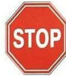
ДВИЖЕНИЕ БЕЗ ОСТАНОВКИ ЗАПРЕЩЕНО