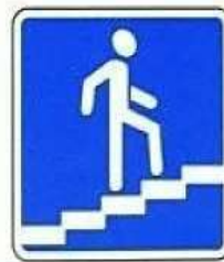
ПОДЗЕМНЫЙ И НАДЗЕМНЫЙ ПЕШЕХОДНЫЕ ПЕРЕХОДЫ